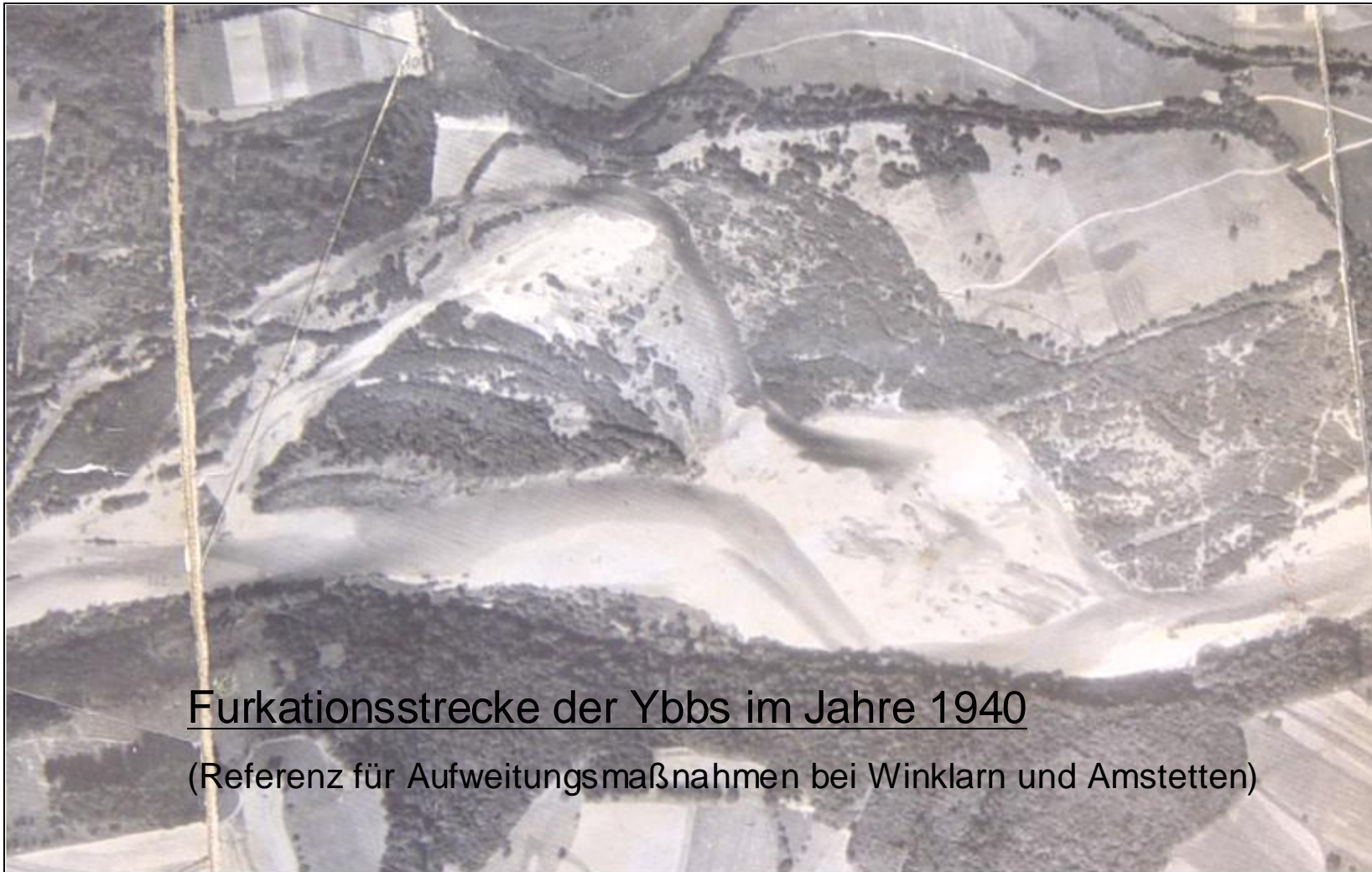
Furkationsstrecke der Ybbs im Jahre 1940

(Referenz für Aufweitungsmaßnahmen bei Winklarn und Amstetten)