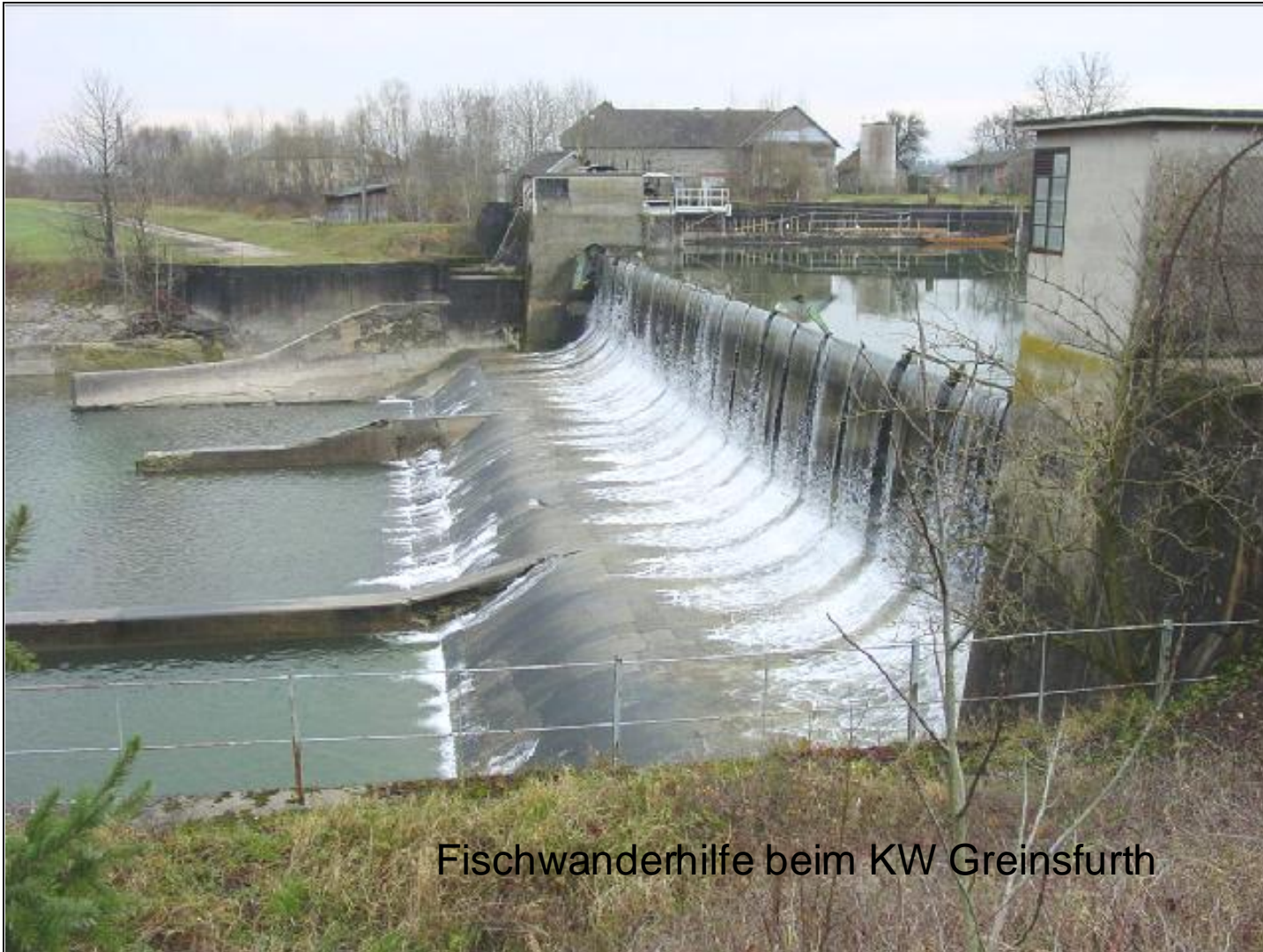
Fischwanderhilfe beim KW Greinsfurth